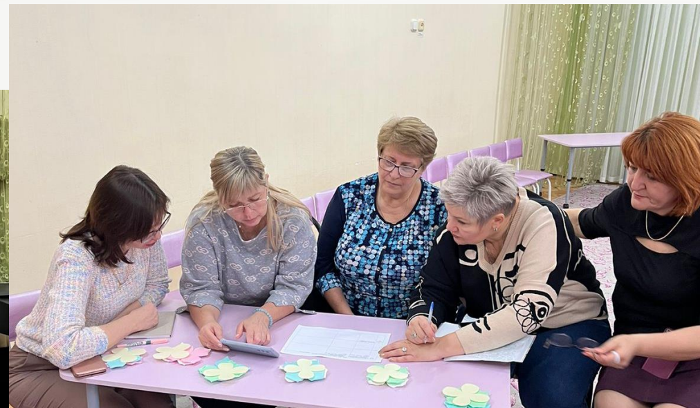
Деловая игра «Челлендж – это здорово!»