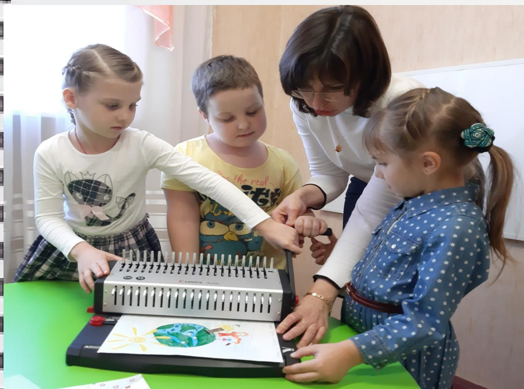
Заключительный этап – сборка журнала