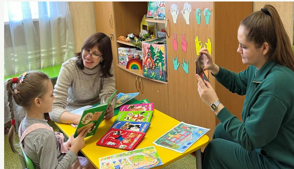
Подготовка и оформление флэшбука «Моя любимая книга»