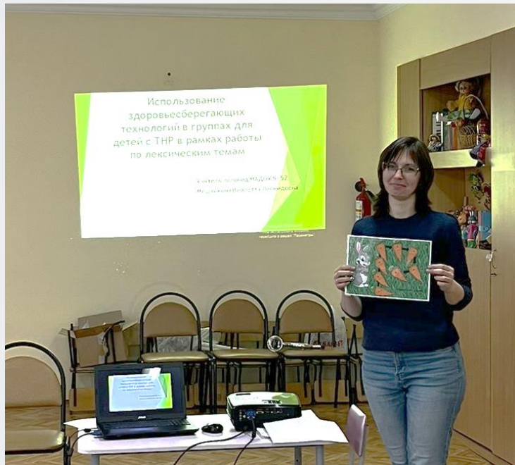
Практическая лаборатория «Твори добро»