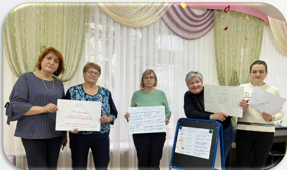
деловая игра «Челлендж – это здорово!»