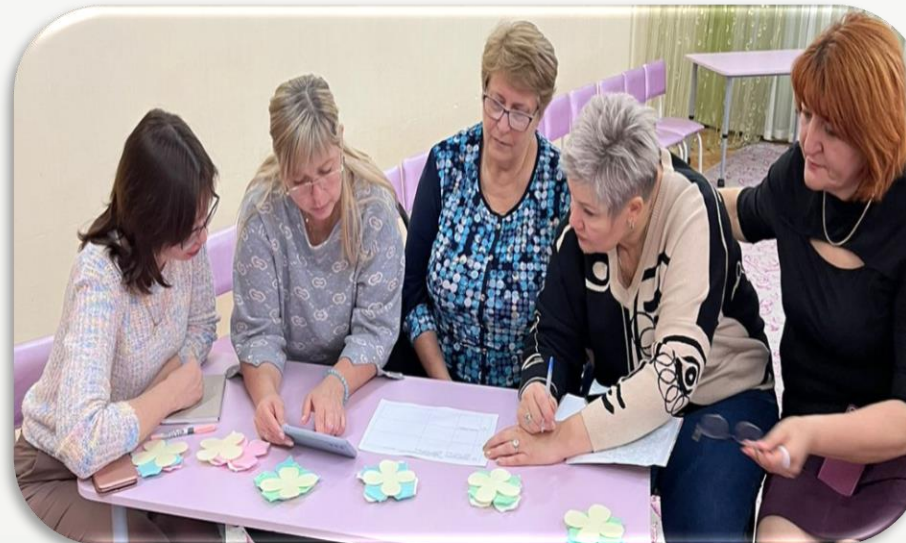
«Флэшбук дома и в саду»