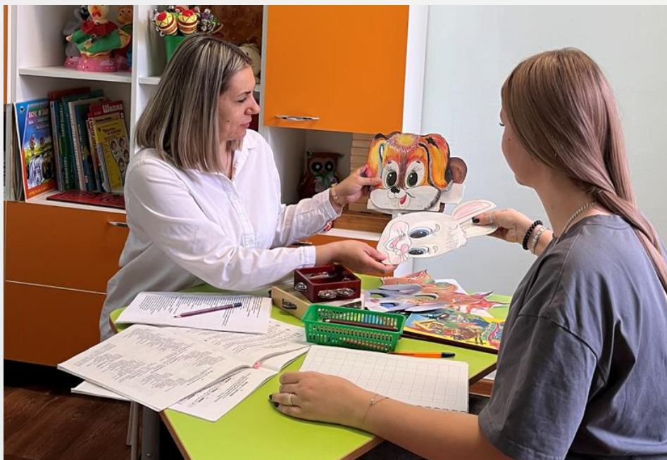
Подготовка «Перформанса» «Заюшкина избушка»